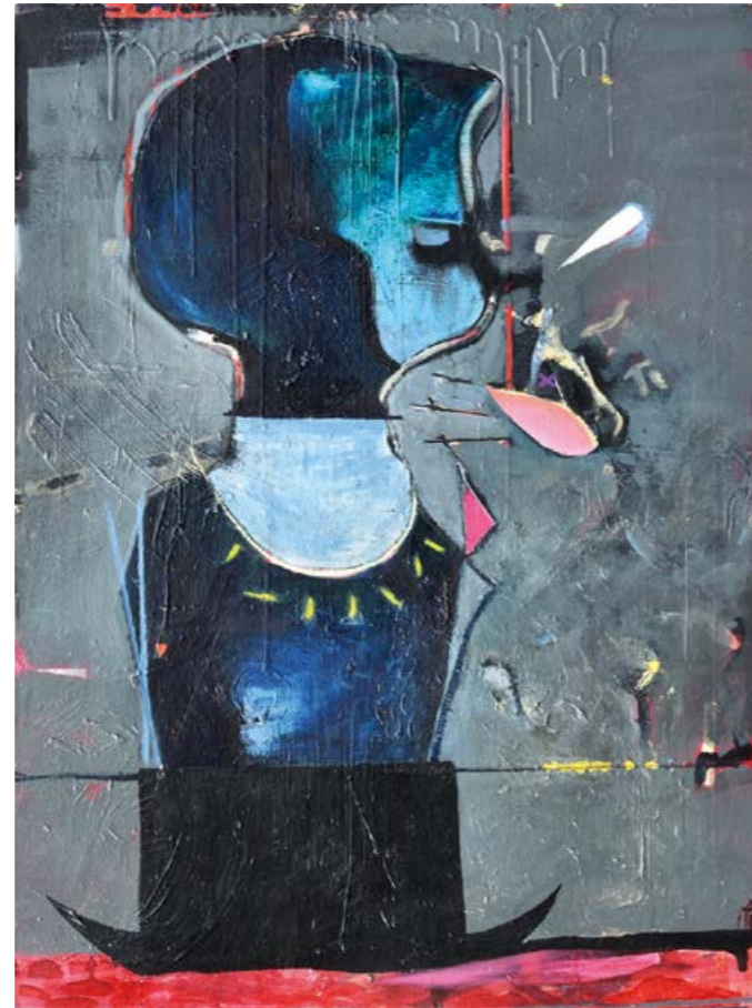
boatpeople, 2018. Öl auf Leinwand, 80 x 60 cm