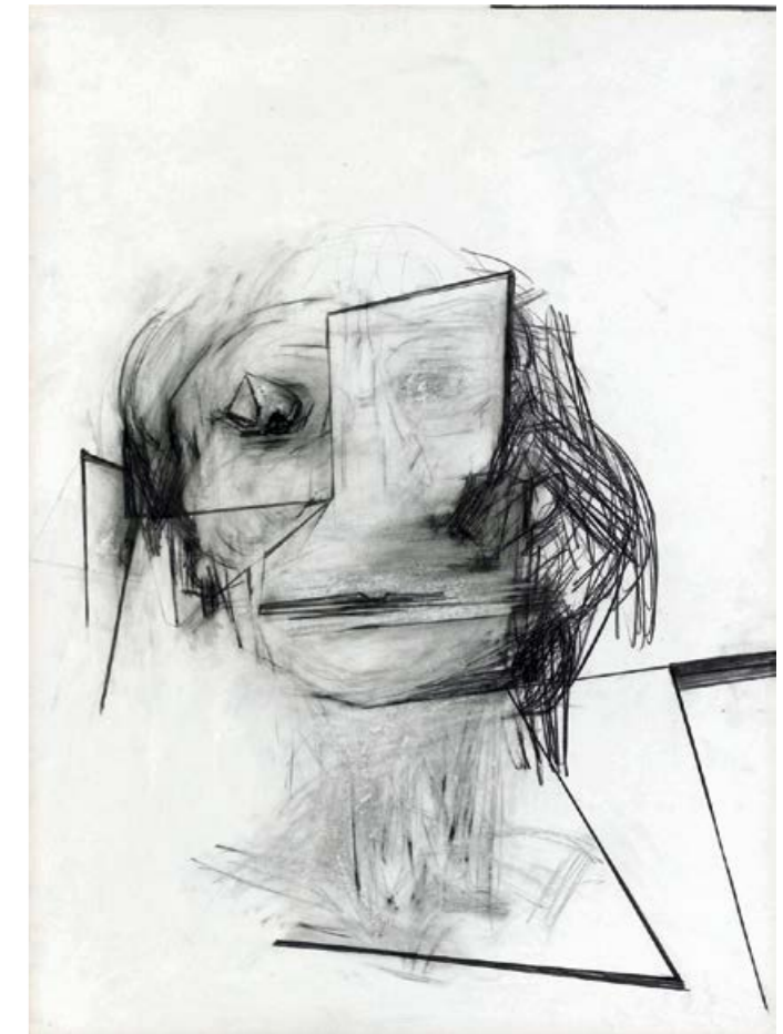
Porträt A. K., 2017. Graphit auf Papier, 100 x 75 cm