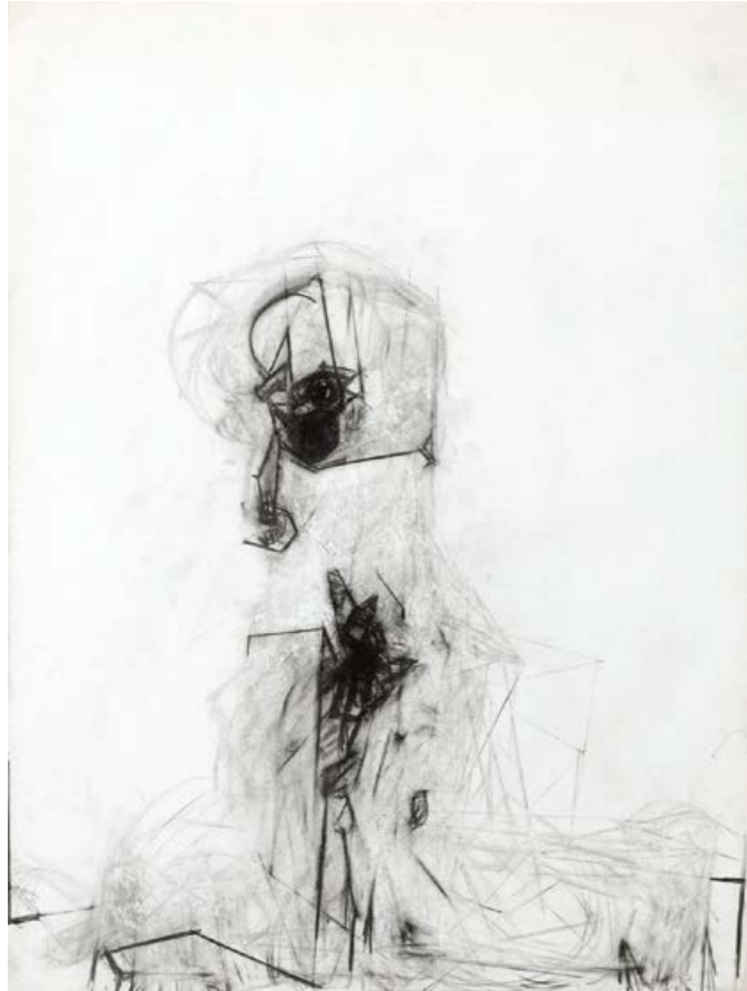
Absprung, 2013. Graphit auf Papier, 100 x 75 cm