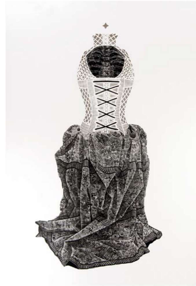
OPHELIA IV/2, 2017. Mezzotinto, Papierschnitt, ca. 135 x 93 cm