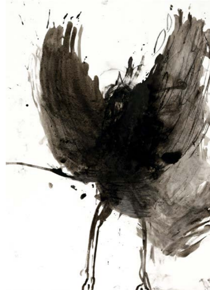
Tanzvogel, 2021. Tusche auf Papier, 86 x 61 cm