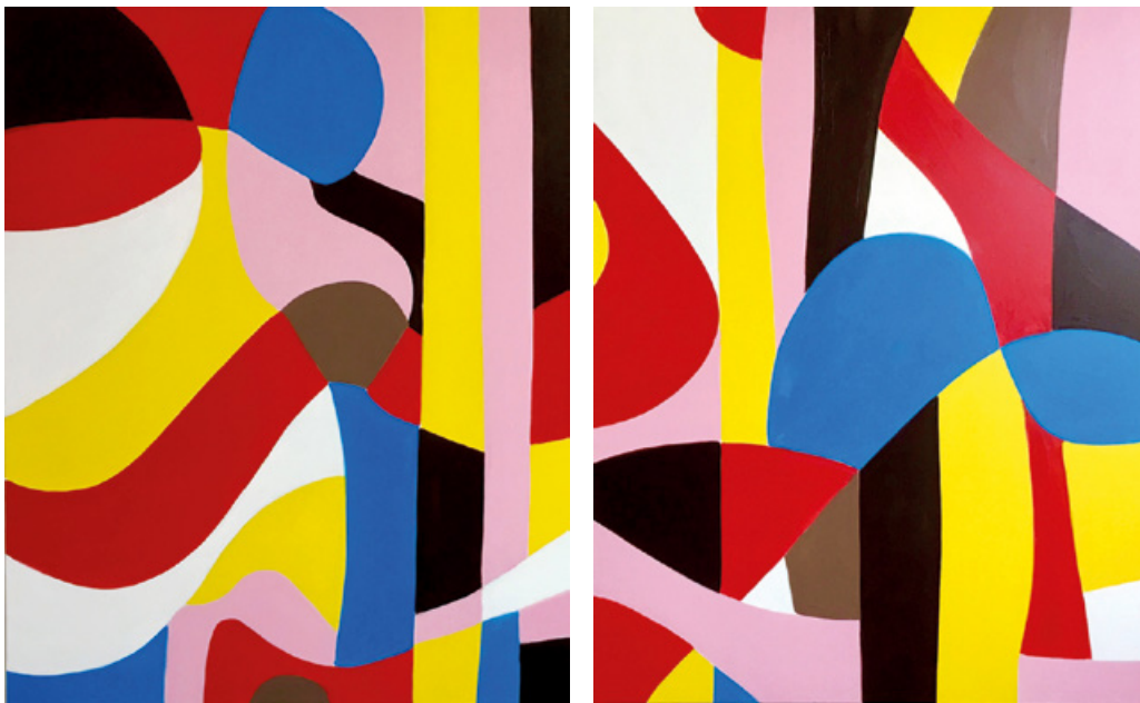
Andrea Thoma www.andreathoma.com Folded Colour / Flamenco, Diptychon, 2019. Öl auf Leinwand, je 100 x 80 cm.